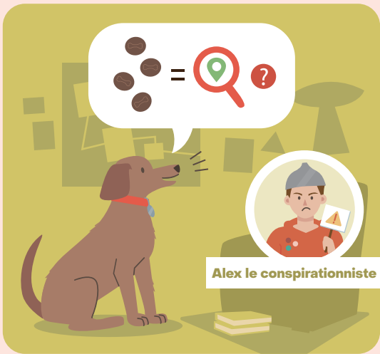
Alex le conspirationniste

Il n'y pas de traçabilité pour les produits vendus en vrac ?